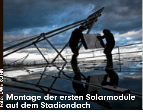
Montage der ersten Solarmodule auf dem Stadiondach

Halle – G esprochen wurde darüber seit 15 Jahren, jetzt ist es endlich soweit! Heute wird der Neubau der Theater-Werkstatt eingeweiht. In das Gebäude an der August-Bebel-Straße ziehen das Metallatelier und die Kostümschneiderei ein. Der dreistöckige Bau kostete ca. 2,35 Mio. Euro. Rund 1,8 Mio. Euro flossen aus dem Konjunkturpaket II. Den Rest finanzierte die Theater, Oper und Orchester GmbH.