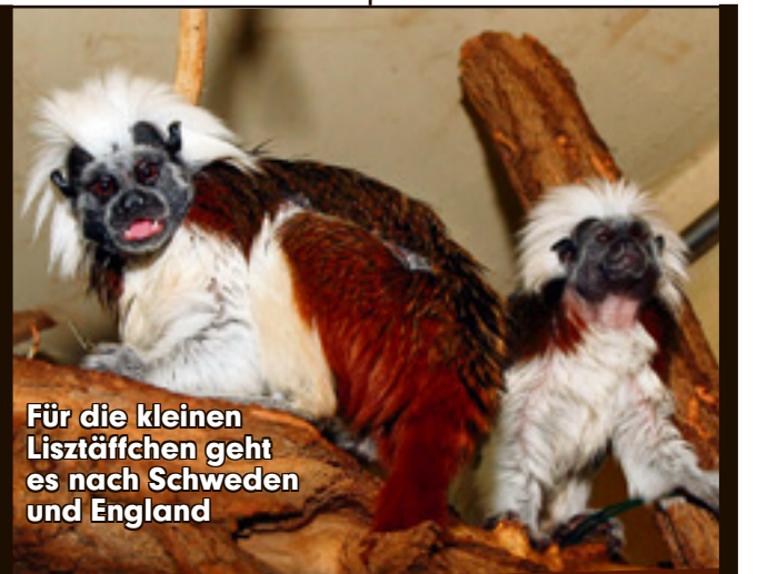
Für die kleinen Lisztiaffen geht es nach Schweden und England

Halle - Finanzspritze für Halles Wissenschaft! Das Land fördert die Gründung des Campus für „Pflanzenbasierte Ökonomie“ in den kommenden drei Jahren mit 1,4 Mio. Euro. Heute wird in Halle eine Kooperationsvereinbarung zwischen dem Kultusministerium, der Universität und den drei beteiligten Leibniz-Instituten unterzeichnet. Ziel des neuen Campus: die Zusammenarbeit zwischen Wissenschaft und Wirtschaft zu fördern.