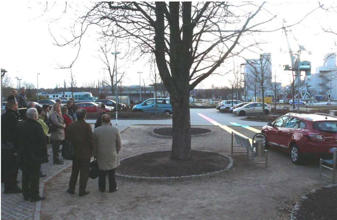
Anhaltewege bei Tempo 30 und Tempo 50 – Demonstration des VCD